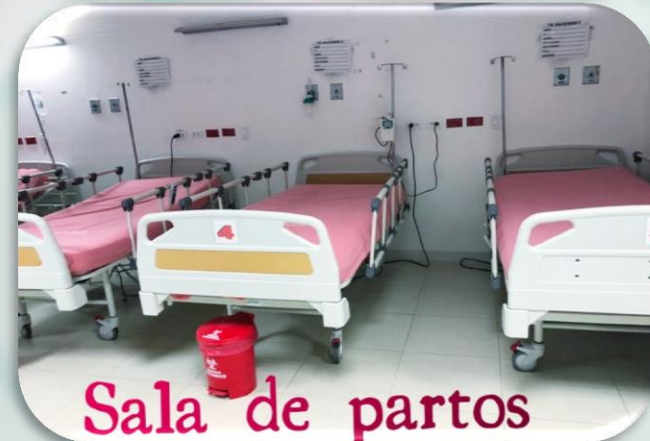
Sala de partos